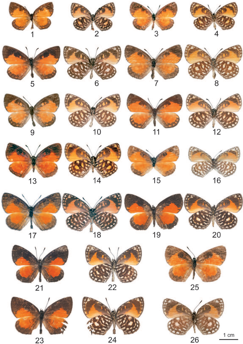
Fig. 1-26. – Liptena spp., faces dorsale et ventrale. – 1-4, L. amabilis Schultz, du Cameroun (Ebogo) : 1-2, ♂ ; 3-4, ♀. – 5-8, L. fallax n. sp. : 5-6, ♂ holotype ; 7-8, ♀ allotype. – 9-14, L. fallax n. sp., du Cameroun : 9-10, ♂ (Afanessélé) ; 11-12, ♀ (Ototomo) ; 13-14, ♂ (mont Messa). – 15-16, Liptena sp., ♀ de République démocratique du Congo (Isiro). – 17-18, L. lualaba lualaba Berger, ♂ holotype. – 19-22, L. lualaba diminuta n. ssp., de RDC (Mamove) : 19-20, ♀ allotype ; 21-22, ♂ holotype. – 23-26, L. lualaba nyanzae Congdon et al. , de Tanzanie (Minziro) : 23-24, ♂ ; 25-26, ♀.